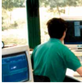
Particolari linee produttive e esterno uffici