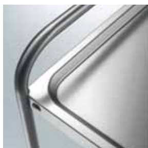
Particolare del carrello