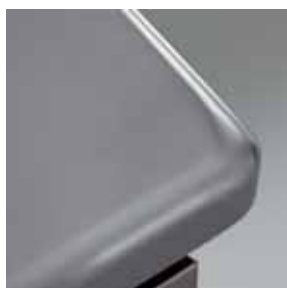
Particolare piano raggiato