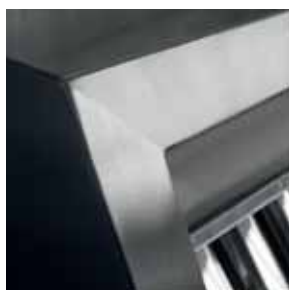
Particolare angoli saldati