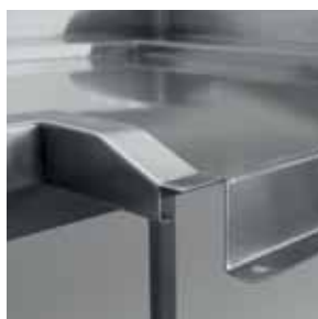
Particolare tavolo entrata