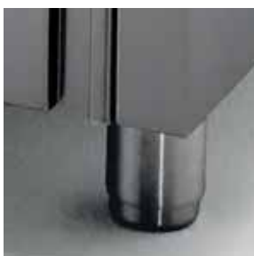
Particolare piedino inox