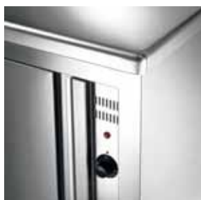
Particolare dettaglio armadio caldo