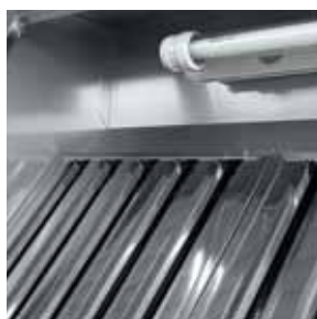
Particolare filtro a labirinto