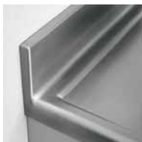
Particolare alzatina chiusa posteriormente