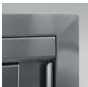
Particolare angoli superiori saldati