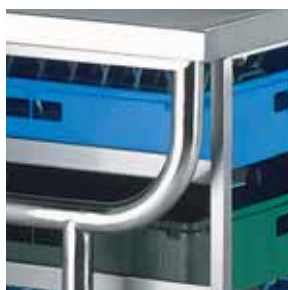
Particolare struttura a sbalzo